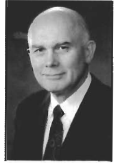
เจอร์เกิ้ล เคิลลิน เอช. เอกส์

ศาสนาจักรฯ บิดามารดา และสมาชิกคนอื่นๆ ของศาสนาจักรฯ ควรปฏิบัติอย่างไรเมื่อเผชิญหน้ากับการทำหายทางศาสนาทางอารมณ์และของครอบครัวเกี่ยวกับความประพฤติหรือความรู้สึกเช่นนั้น? เราพูดอย่างไรกับคนหนุ่มสาวซึ่งรายงานว่าเขาหรือเธอเสน่ห์หาหรือมีความรู้สึกทางเพศกับคนเพศเดียวกัน? เราควรตอบสนองอย่างไรเมื่อมีคนประกาศว่าเขาหรือเธอเป็นพวกหลักเพศ และยังประกาศด้วยว่ามีหลักฐานทางวิทยาศาสตร์ที่ได้ ‘พิสูจน์’ แล้วว่าเขาหรือเธอเป็นเช่นนั้นมาตั้งแต่กำเนิด? เรามีปฏิบัติอย่างไร เมื่อมีคนที่ไม่ได้อยู่ในความเชื่อเดียวกับเรามาต่อว่าเราที่เรามีจิตใจคับแคบหรือไม่มีความเมตตาเพราะเรายินกรานว่าการมีความรู้สึกทางเพศต่อคนเพศเดียวกันเป็นสิ่งที่ผิดปกติและความประพฤติใดๆ ในลักษณะนั้นเป็นบาป?