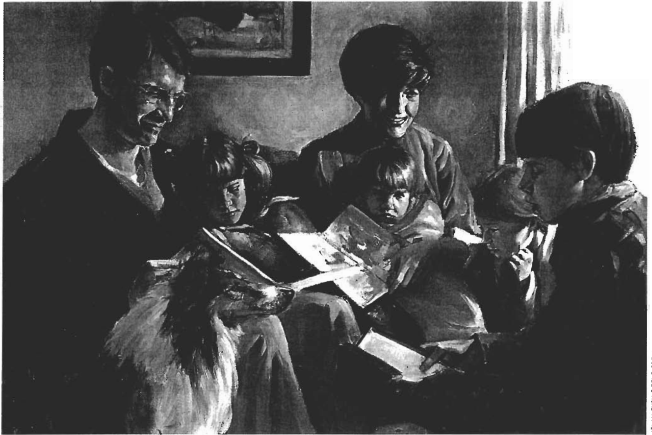
AIA NA TUSIA E DEL PARSON

O le faamoemoega o le olaga faitino ma le misiona a le Ekalesia a Iesu Keriso o le Au Paia o Aso e Gata Ai o le saunia lea o atalii ma afafine o le Atua mo lo latou taunuuga—ina ia avea e faapei o o tatou matua faalelagi.