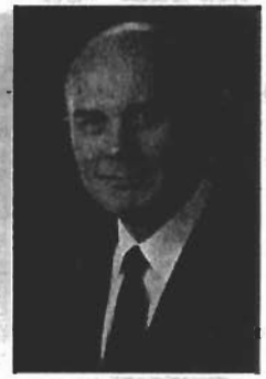
Elder Dallin H. Oaks

faapena. E tatau faapefea i taitai o le Ekalesia, matua, ma isi, tagata o le Ekalesia ona tali atu pe a feagai ma ni luitau faalelotu, lagona, ma faaleaiga e o mai faatasi ma nei ituaiga amioga po o uiga? O le a sa tatou tala e fai atu i se tagata talavou o lē ua ia lipotiina mai o ia ua tosina atu po o le iai o ni ona lagona po o ni manatu faapena i se tagata o le ituaiga lava e tasi? E tatau faapefea ona tatou tali atu pe a faailoaina mai e se tagata o ia o se faatauatane po o ia o se faatauafafine ma ua faamaonia mai na fanau mai lava o ia e faapena? E faapefea ona tatou tali atu i ni tagata e le tutusa o tatou talitonuga ua latou tuuaina i tatou i lo tatou le faapalepale po o le lē alolofa pe a tatou tumau pea ona fai atu o ni lagona tuinanau i le isi tagata o le ituaiga lava e tasi e lē o se mea masani ma o so o se ituaiga amioga faafeusuai lava o lena tulaga o se matuai agasala lava?