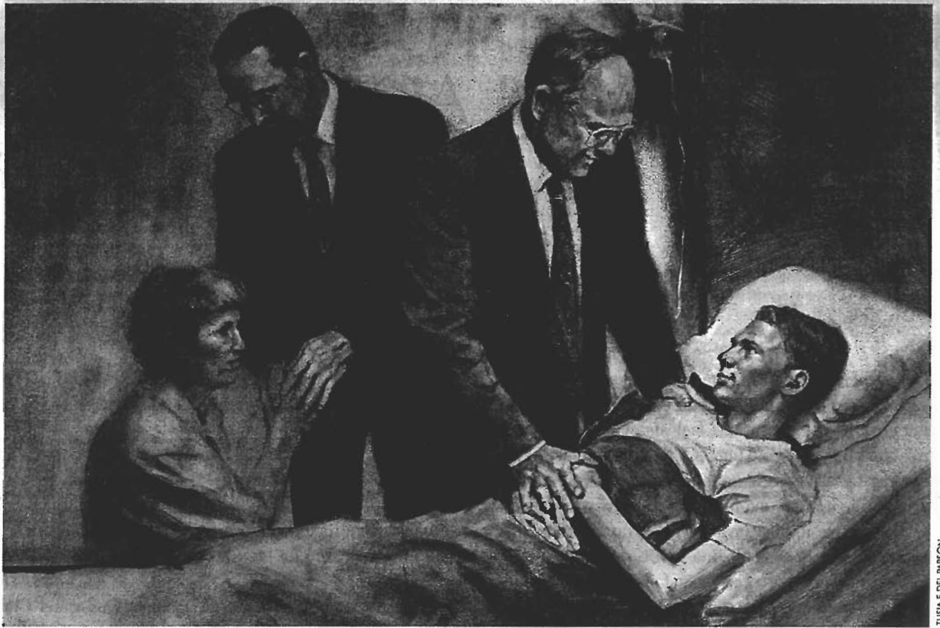
TUSIA E DEL PARSON

E tatau ona tatou faailoa atu le alofa ia i latou o ē o lo o pologa i ma'i o le tino, e aafia ai i latou ua aafia i le HIV po o ē ua maua i le AIDS (o ē atonu na latou, pe latou te le'i mauaina mai ia tulaga i ni tulaga faafeusui). E tatau ona tatou uunaia ia tagata e auai i gaoiiga a le Ekalesia.