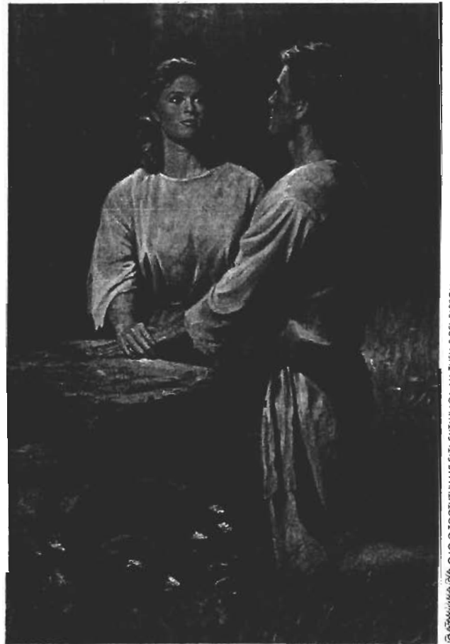
© ATAMU/MA EVA O LO O TOOTUTU I LE FATA FATAIAGA, NA TUSIA E DEL PARSON

O nisi tagata o le Au Paia o Aso e Gata Ai o lo o feagai ma le le mautonu ma le tige e mafua mai pe a faia e se tane po o se fafine ni amioga faafeusui ma se tagata o le ituaiga lava e tasi, po o le iai foi o ni lagona faapena i le tagata lea e mafai ai ona taitaiina atu ai i ni amioga