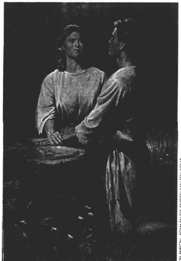
DEL PARSON, ADAM EN EVA KNIETEN AAN EEN ALTAAR

Sommige heiligen der laatste dagen gaan gebukt onder de verwarring en hartepijn die het gevolg zijn van seksuele handelingen met iemand van hetzelfde geslacht, of zelfs van erotische gevoelens die tot dergelijk gedrag kunnen leiden. Hoe moeten kerkleiders, ouders en andere leden van de kerk