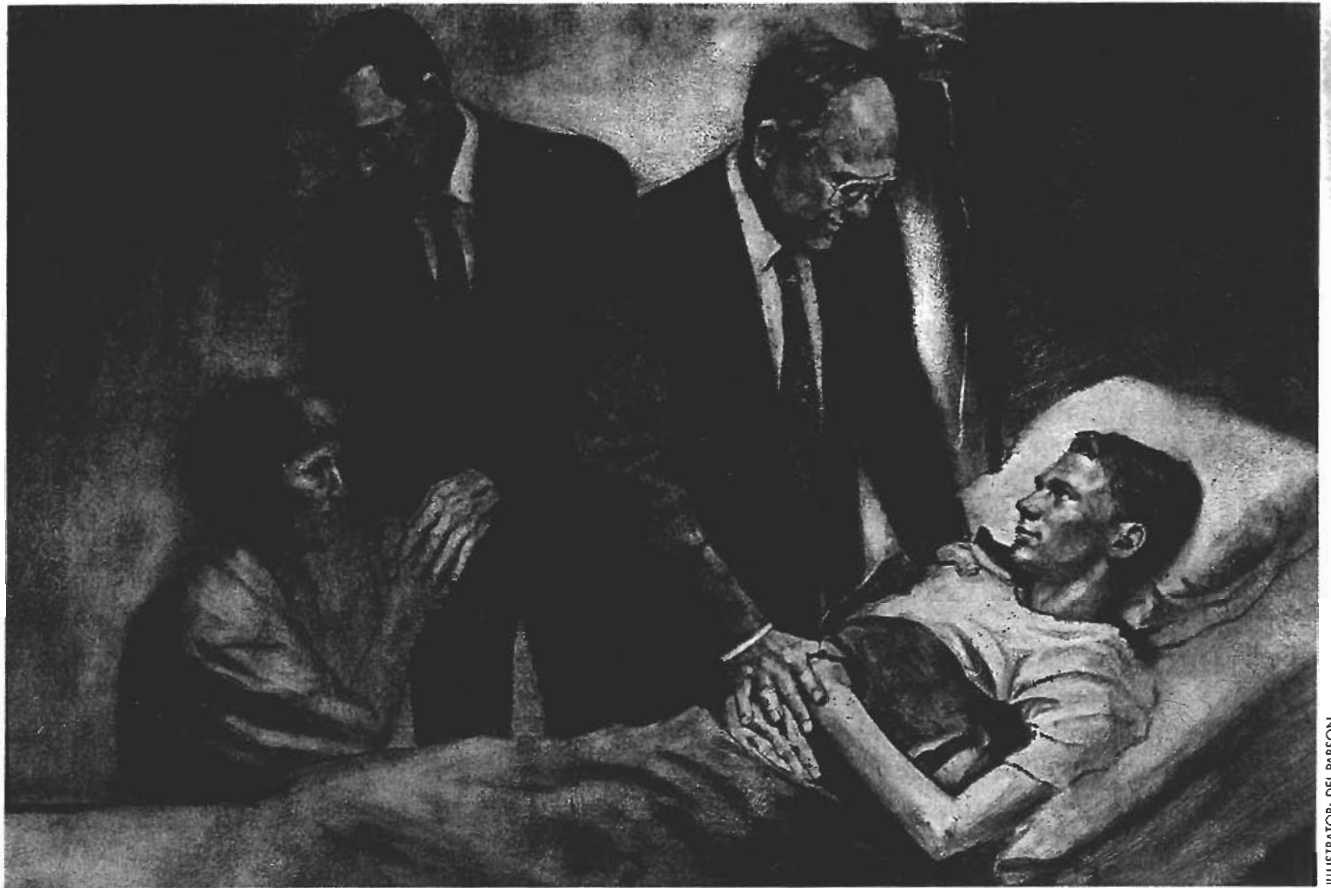
ILLUSTRATOR: DEL PARSON

7. Omdat Satan 'tracht alle mensen even ellendig te maken als hij zelf is' (2 Nephi 2:27), richt hij zijn grootste inspanningen op het stimuleren van de keuzen en daden die Gods plan voor zijn kinderen dwarsbomen. Hij probeert het beginsel van de individuele verantwoordelijkheid te ondermijnen, hij wil ons overhalen om ons heilige voortplantingsvermogen verkeerd te gebruiken, hij ontmoedigt goede mannen en vrouwen om te trouwen en kinderen te krijgen, en brengt mensen in verwarring over wat het wil zeggen om man of vrouw te zijn.