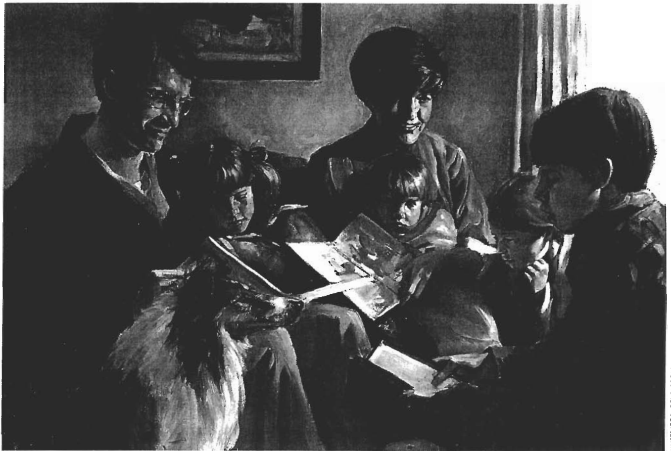
ILLUSTRATOR: DEL PARSON

nemen, omdat God hun die verantwoordelijkheid heeft gegeven.