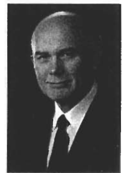
Ældste Dallin H. Oaks

udfordringer af religiøs, følelsesmæssig og familiemæssig karakter, som følger med en sådan adfærd eller følelse? Hvad siger vi til et ungt menneske, som fortæller, at han eller hun er tiltrukket af eller nærer erotiske følelser for personer af sit eget køn? Hvordan skal vi reagere, når et menneske erklærer, at han er homoseksuel, eller at hun er lesbisk, og at videnskaben har »bevist«, at han eller hun er »født sådan«? Hvordan skal vi reagere, når mennesker, som ikke deler vores tro, anklager os for at være intolerante eller ubarmhjertige, når vi fastholder, at erotiske følelser for en person af samme køn er ukorrekte, og at enhver seksuel adfærd af den karakter er syndig?