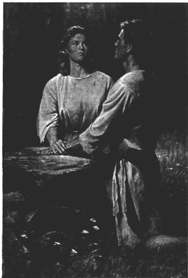
ADAM OG EVA KVALER VED ETÅTER, AF DET MAISON

Tiltrækningen mellem mand og kvinde er ilagt af Skaberen for at sikre jordelivets videreførelse og for at knytte ægtemand og hustru sammen i det familieforhold, som han har foreskrevet til opnåelse af sine hensigter, deriblandt opdragelsen af børn.