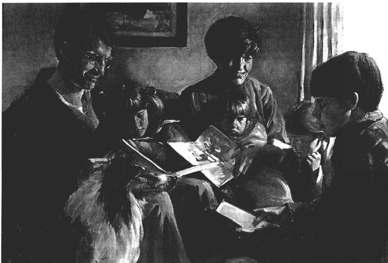
ILLUSTRERET AF DEL PEARSON

Formålet med dette liv og Jesu Kristi Kirke af Sidste Dages Helliges mission er at berede Guds sønner og døtre til deres mål – at blive som vores himmelske forældre.