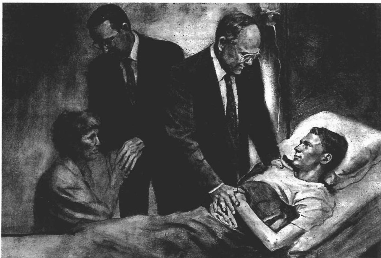
ILLUSTRERET AF DEL PARSON

Vi bør udvise medfølelse med mennesker, som lider af sygdomme, deriblandt dem, som er smittet med HIV, eller som er syge af AIDS (og som måske eller måske ikke har fået smitten gennem seksuelle forbindelser). Vi bør opmuntre sådanne mennesker til at deltage i Kirkens aktiviteter.