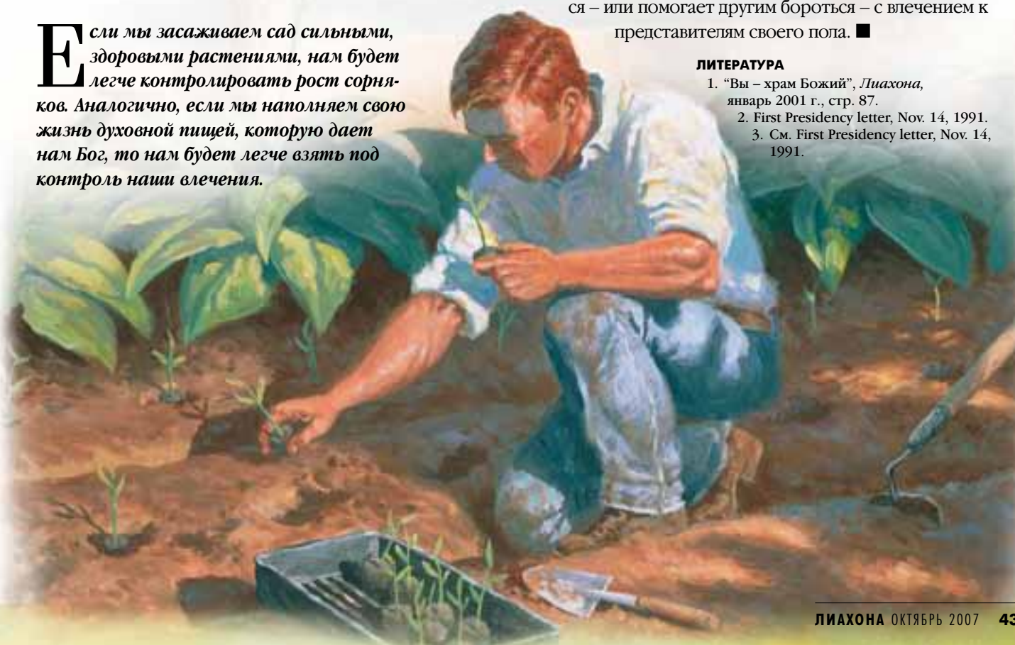
РИСУНОК КЛАРКА КЕЛЛИ ПРАЙСА